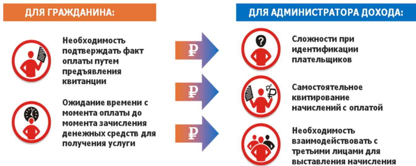
Рис. 1 – Предпосылки создания системы

РИС ГМП предоставляет весь функционал, необходимый для эффективного взаимодействия главных администраторов доходов, администраторов доходов, многофункциональных центров, операторов регионального портала государственных услуг (далее – участники) с федеральным сервисом.